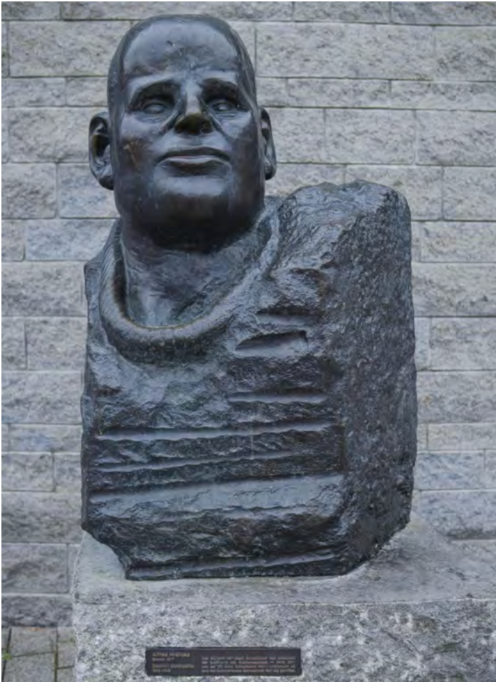
Denkmal von Dietrich Bonhoeffer im Kocherquartier, Schwäbisch Hall, Baden-Württemberg

katholischen Gesangbuch. Der Text bildet den Abschluss eines Briefes an seine Verlobte Maria von Wedemeyer. Zur Erinnerung: Die Verlobung findet Anfang Januar 1943 statt. Im April wird er bereits verhaftet. Und er bleibt in Haft bis zu seinem Tod. Dass er seine Verlobte nicht mehr sehen kann, das tut seiner Zuneigung und Liebe keinen Abbruch.