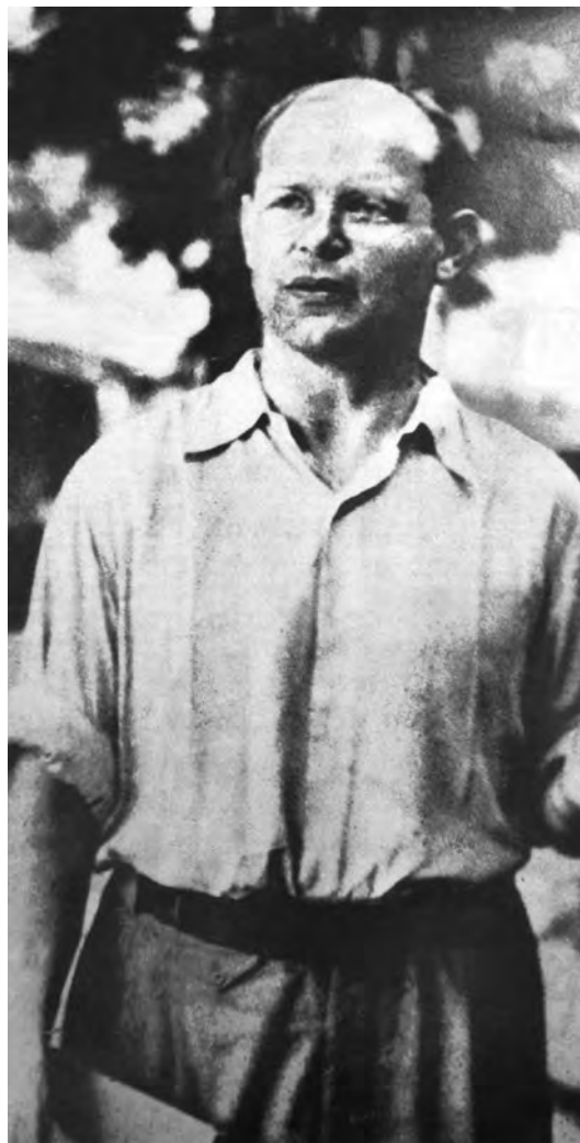
Dietrich Bonhoeffer (1906-1945), deutscher Theologe, undatierte Aufnahme aus dem Jahr 1932